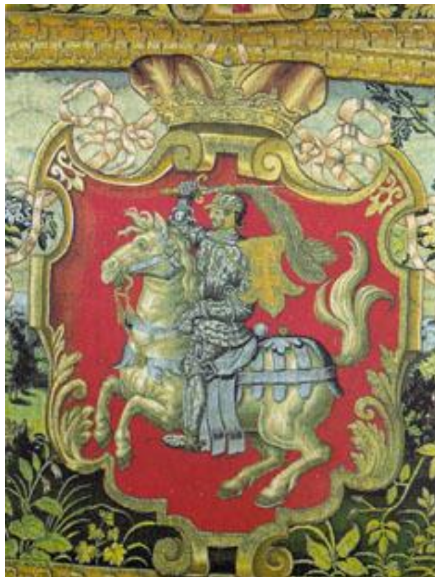
Vytis from the period of the Grand Duchy of Lithuania. Tapestry at Wawel Castle, Cracow